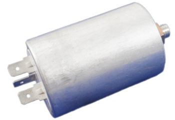
CAPACITOR P/ AR CONDICIONADO (DIVERSAS MARCAS) 11417